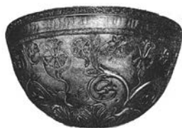
Парфянская серебряная чаша. Государственный Эрмитаж

Серебряные чаши, изготовленные на Среднем Урале