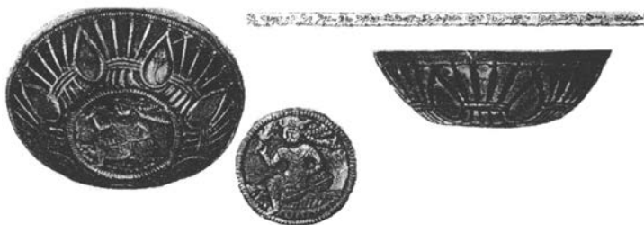
Хорезмийские чаши [Толстов С.П., 1948]