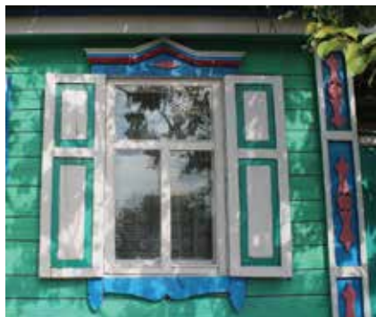
Тәрәзә йөзлегә бизәлешләрә