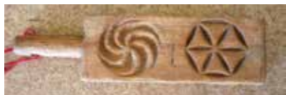
Татлы ризык пешерер өчен кулланма. Кызан