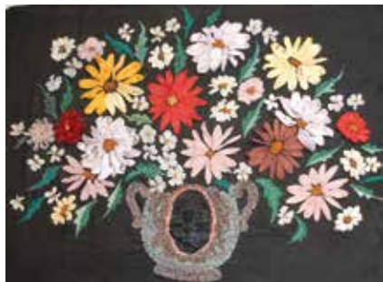
Төрле төстөгә тасмалардан чигелгән панно