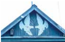
Пар күгәрченнәр төшерелгән өй кыягы. Каргалык