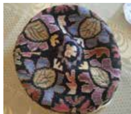
Юрт татарлары түбәтәе. Жәмәле