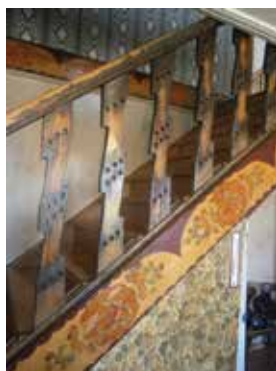
Баскычның декоратив бизәге