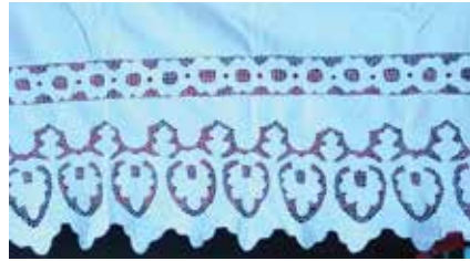
Кашага. XX гасыр уртасы. Кызан