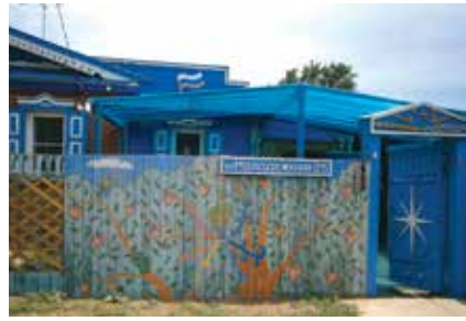
Йорт алды һәм капка бизәлешә. Киләчә