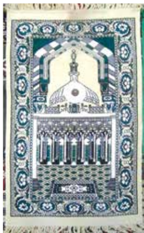
Намазлык. Ярлы Түбә