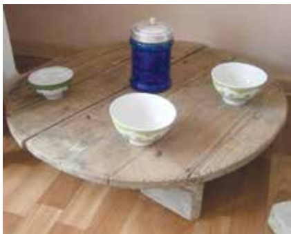
Күна. Мәктәп музейе. Жәмәле