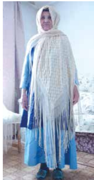
Фабрика шәле. XX гасырның II яртысы. Жәмәле