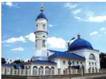
Ак мәчет. Әстерхан