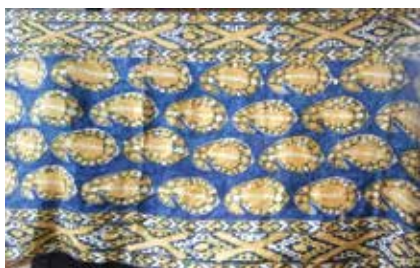
Билбау. Көнчыгыш орнаментлары белән эффектән тукылган ирләр өчен билбау. Жәмәле