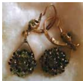
Алка. XX гасыр башы.