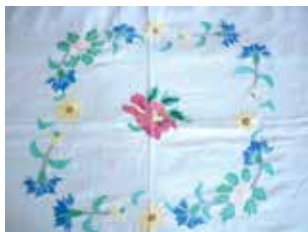
Ашъяулык фрагменты. Шома чигүле. Кызан