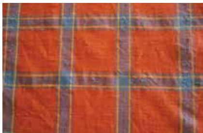
Шакмаклы тукума үрнәге. XX гасыр башы. Кызан Ашъяулык фрагменты. XX гасыр уртасы. Кызан