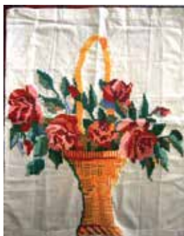
Салфетка һәм аның фрагменты. Болгарча тапкырлап чигү. XX гасыр уртасы. Кызан