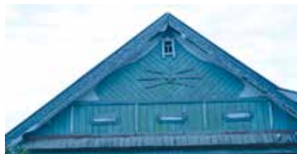
Өй түбәсе. Каргалык