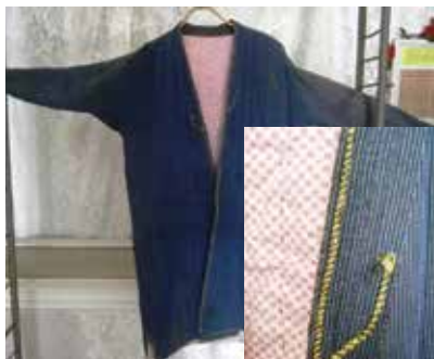
Каптал – ир-атлар халаты. Киләче