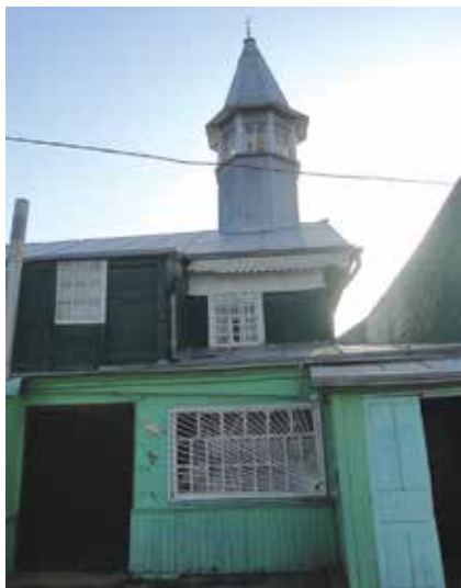
Нугай мәчет. Әстерхан