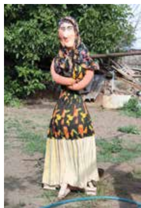
Бакча карачкысы итеп ясалган «Масленица» курчагы