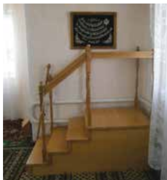
Ярлы Түбә авылы мәчете һәм аның эчке күренеше.