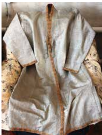
Каптал. Ир-ат халаты. Жәмәле