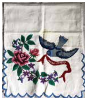
Кульяулык. Шома чигүлө