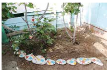
Төрле төсләргә буялган ташлардан торган газон