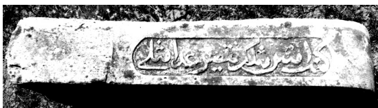
Кызан авылы зиратындагы каберташлары