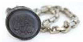
Мөһер. М.Х. Гомәрованың шәхси архив-музееннан. Жәмәле