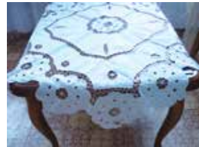
Өстәл жәймәсе. Ришелье. XX гасырның II яртысы. Жәмәлә