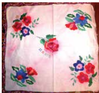
Япма. Шома чигүле. Мәрзия Ходжаева эше. Ярлы Түбә