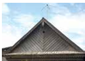
Өй кыяклары. Киләче