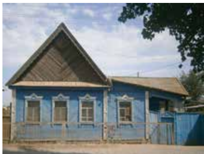
Ярлы Түбә авылы йортлары