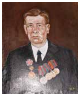
Әтисе Исаков Хажитархан Ильяс улы портреты