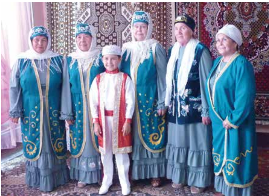
«Каргалыклар» жыр ансамбле. Каргалык