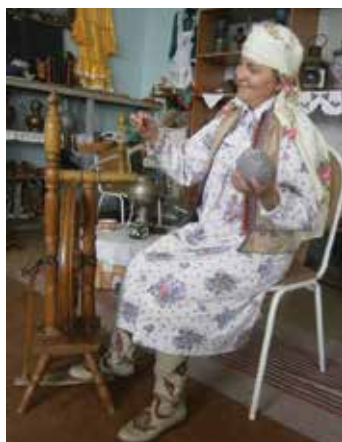
Хатын-кыз киеме. Ярлы Түбә