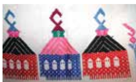
Салфетка фраг- менты