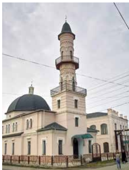
Кара мәчет. Әстерхан