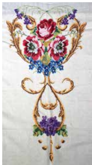
Тәрәзә пәрдәсә фрагменты