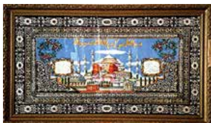
Шәмаил. XX гасырның I яртысы. Б.Р. Бердиева йорты