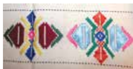
Сөлге һәм аның фрагментлары