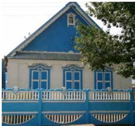
Киләче авылы йортлары