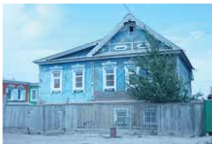
Авыл йортлары. Каргалык