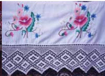
Шома чигүле мендәр тышлыклары, карават кашагасы һәм аның фрагменты. XX гасыр уртасы. Каргалык