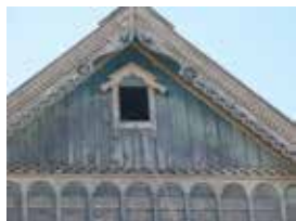
Кечкенә тәрәзәле өй кыяклары. Майлы Күл