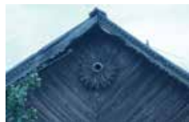
Түгәрәк тәрәзәле өй түбәсе. Каргалык