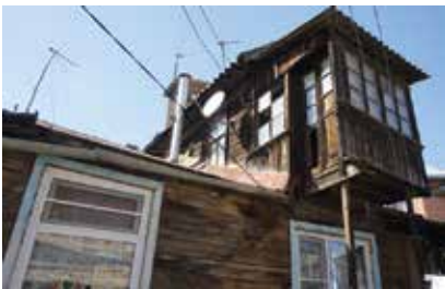
Өстерханга дөваланырга килгәч, Г. Тукай яшәп киткән йорт