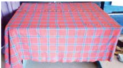
Шакмаклап туқылган ашъяулык. XIX гасыр. Кызан