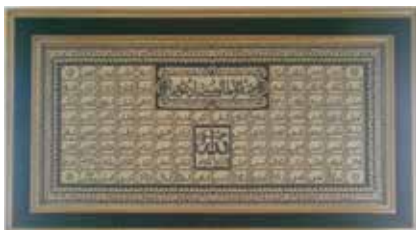
Шәмаил. Ярлы Түбә