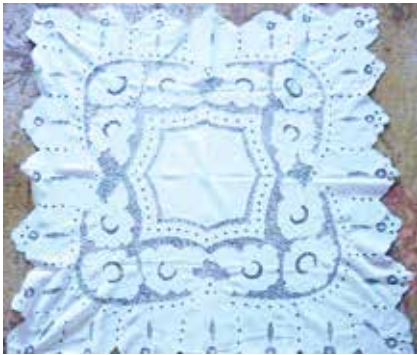
Мендәр япмасы. Ришелье. XX гасыр уртасы. Майлы Күл