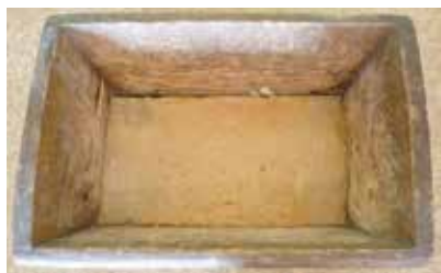
Ит турар өчен савыт. XX гасырның II яртысы. Кызан.