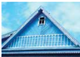
Фронтон тәрәзәләр. Жәмәлә