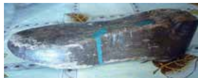
Калып (носки ямаганда файдаланылган). 1950 еллар. Кызан