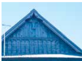
Фронтон тәрәзә. Майлы Күл