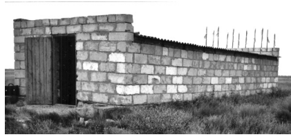
Нур Ата һәм Йегет әүлия дөрбәсе. Киләче авылы зираты

Бу заманда Әстерхан якларында традицион татар ташбилгеләре тибы өстенлек алган. Түбәндә аларның кайбер үрнәкләре бирелә.