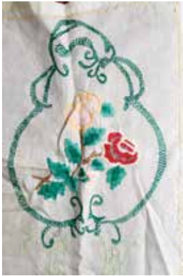
Салфетка. Шома һәм тамбурлы чигүле. Жәмәле