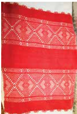
Кызыл башлы сөлгә һәм аның фрагменты. XX гасыр башы. Киләче