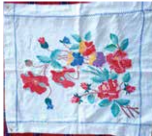
Салфетка үрнәге. XX гасыр уртасы. Кызан