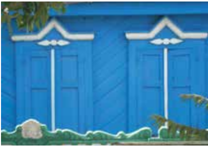
Тәрәзә капкачлары. Киләчә