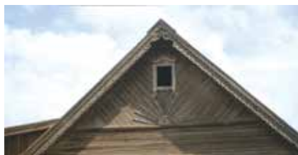
Фронтон тәрәзә. Ярлы Түбә