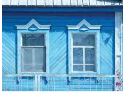
Тәрәзә йөзлегә бизәлешә. Кызан