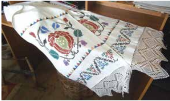
Тапкырлап чигелгән һәм ыргаклы энә белән бәйләнгән солге. Жәмәле