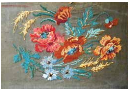
Тапкырлап чигү. XX гасырның уртасы. Канга