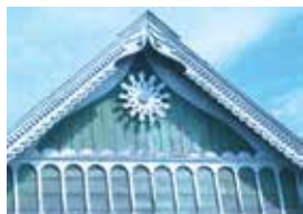
Өй түбәсе. Кызан