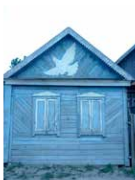
Күгәрчен рәсемле йорт. Каргалык