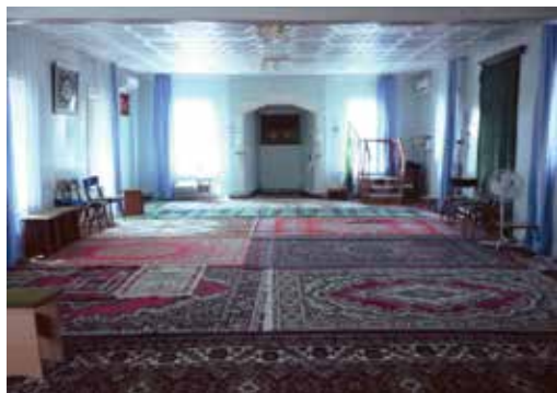
Каргалык авылы мәчетенен (XX гасыр башында төзелгән) эчке күренеше