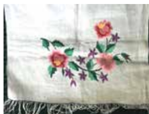
Сөлгә. Шома чигүлө