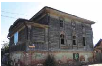
1831 елда төзелгән Яшел мәчет (янадан тергезергә уйлылар)