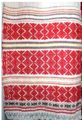
Кызыл башлы сөлгә. XX гасыр башы. Ярлы Түбә