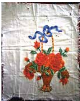
Салфетка. Шома чигү. XX гасыр уртасы. Кызан