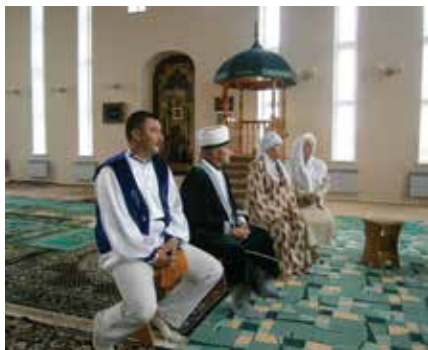
«Машык» (шәмаил). Килчэ мәчете