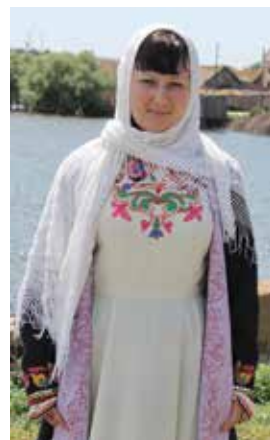
Хатын-кыз костюмы. Сәхнә өчен тегелгән. Кызан