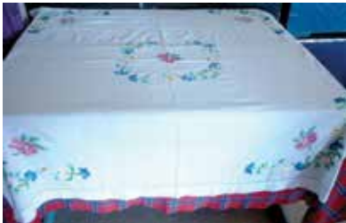
Шома чигүле ашыяулык. XX гасыр уртасы. Кызан