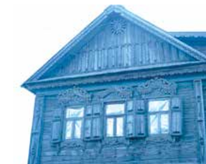
Майлы Кул авылы йортлары