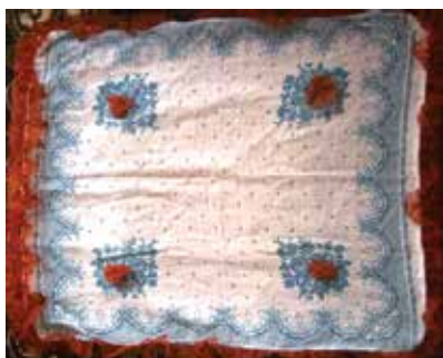
Баян – кызыл тасма йөртелгән яулык. Туйда кулланыла. Каргалык