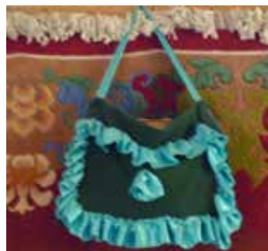
Стенага эленмәле Коръән кабы. XX гасыр ахыры. Жәмәле