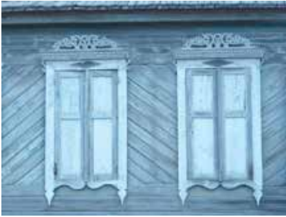
Тәрәзә йөзлегә бизәлешә. Каргалык