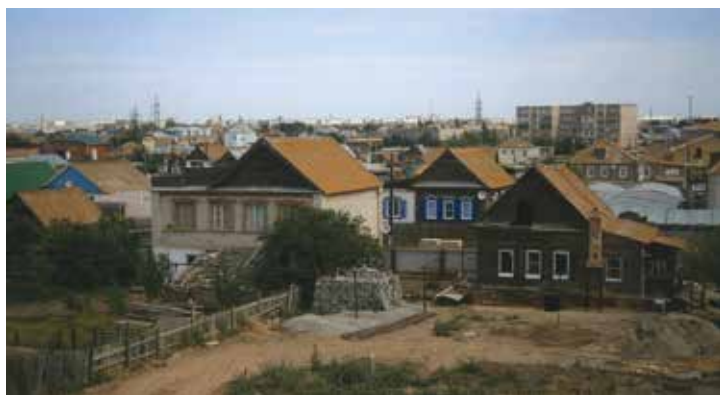
Ярлы Түбә авылы күренеше