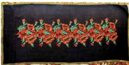
Сөлге. Шома чигүле