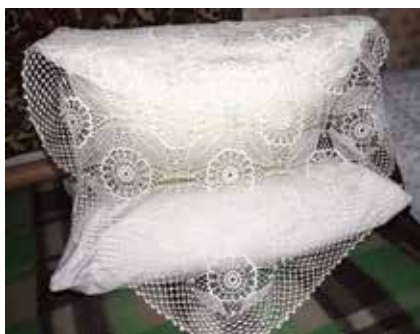
Мендәр остенә челтәр