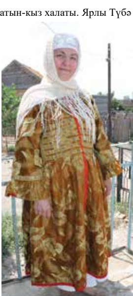
Хатын-кыз халаты. Ярлы Түбә