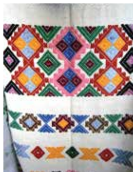
Шакмаклы сөлге башы. Тапкырлап чигү. XX гасырның II яртысы. Ярлы Түбә