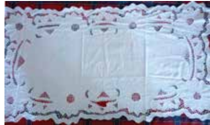
Япма. Ришелье. Кызан