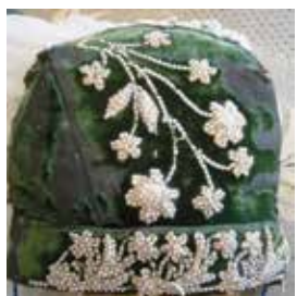
Борынғы эңже калфак. Жәмәле