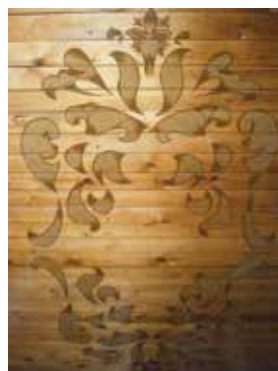
Татар орнаменты традицияләрендә бизәкле түшәм фрагменты