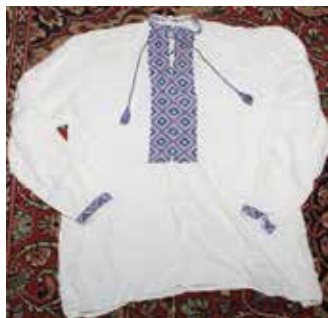
Ир-ат кулмәге. XX гасырның II яртысы. Майлы Күл.