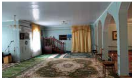
Жәмәле авылы мәчете һәм аның эчке күренеше