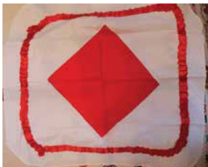
Туй яулыгы. Мәрзия Ходжаева эше. Ярлы Түбә