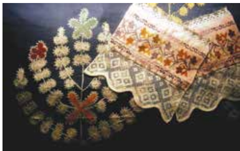
Жәймә һәм челтәрле сөлгә башлары. Әстерхан дәүләт тарихи-архитектура музей-тыюлыгы