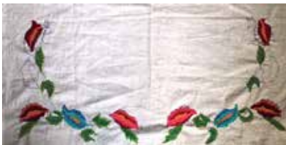
Сөлге. Шома чигүле