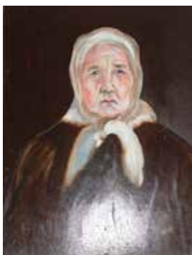
Әбисе Иблиәминова Маһинур Мөхәммәд кызы портреты

Үзешчән рәссам Исаков Әдһәм Хажитархан улының (1959) эшләре. Кызан