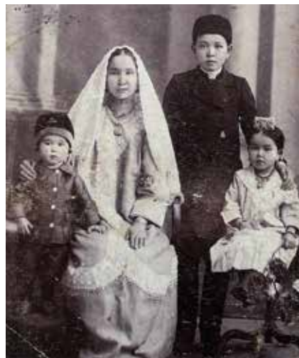
Әстерхан татарлары элекке киёмнәрдә. Жәмәле